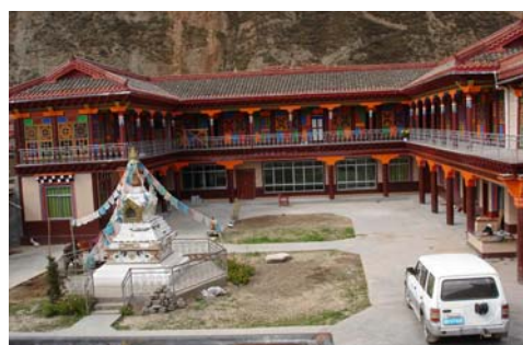
Achèvement travaux - Octobre 2006