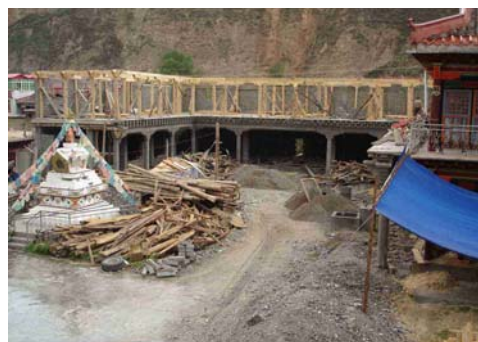
Premier étage en construction