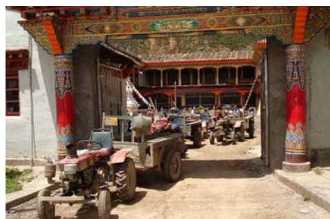
Transport de matériel