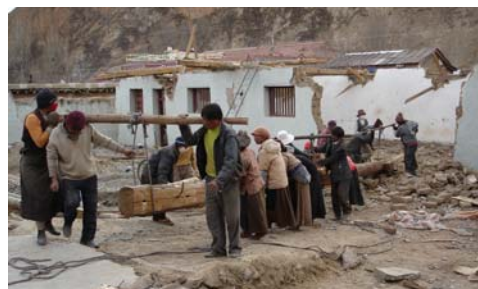
Démolition du bâtiment

Les coûts planifiés pour les gros ouvrages de CHF 135'000.- ont été nettement en dessous du budget. Ceci a été possible, grâce à une bonne planification de la construction et l'achat des matériaux. Les dépenses dans la maison de retraite restent constantes bien que les prix à Ganzi sont en augmentation continue.