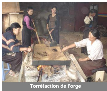
Torréfaction de l'orge