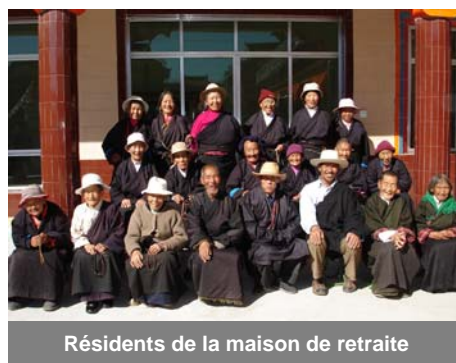
Résidents de la maison de retraite